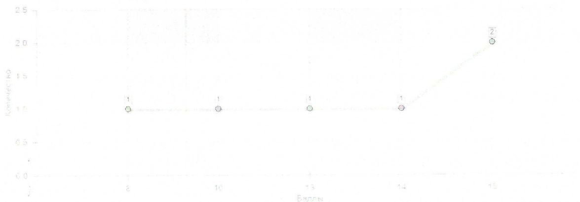
График распределения результатов по баллам